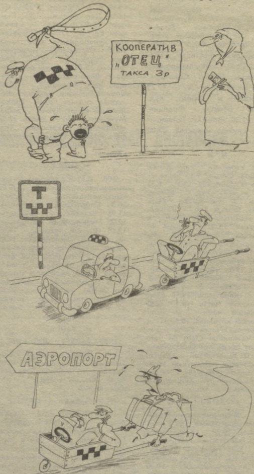
Рис В. МУРОМЦЕВА.