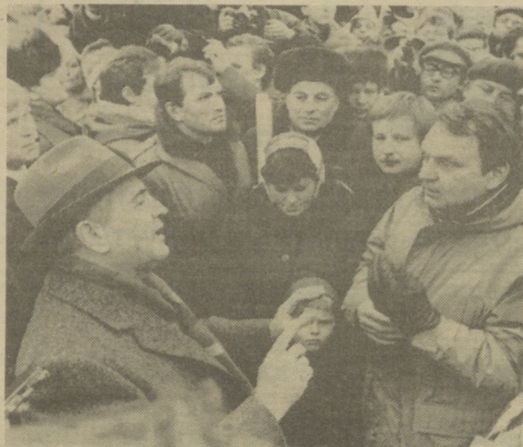
Во время встречи с жителями Вильнюса.