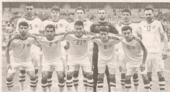
Национальная сборная Узбекистана проведет 2 мая в Анталии товарищеский матч против Турции.

Сборная Узбекистана в июне проведет 3 товарищеских матча, сообщила Ассоциация футбола Узбекистана.