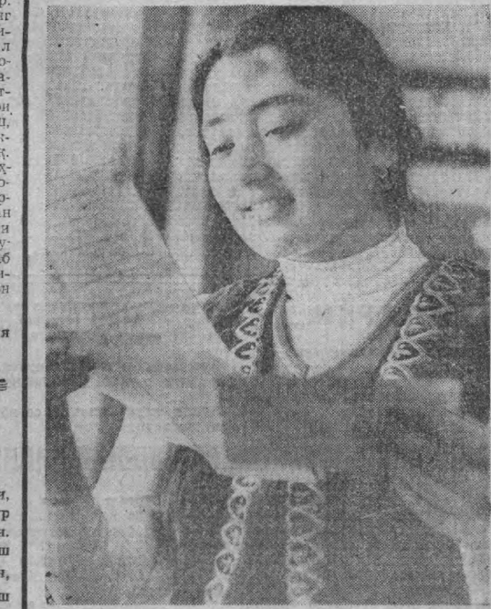
«Еган хатинг қўлимада...» М. Орипов фотозюди.