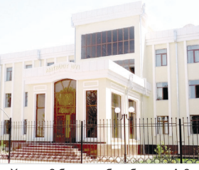
Ҳажми 2 босма табоқ, бичими А-2

Газета ҳафтанинг сешанба, пайшанба ва шанба кунлари чиқади.