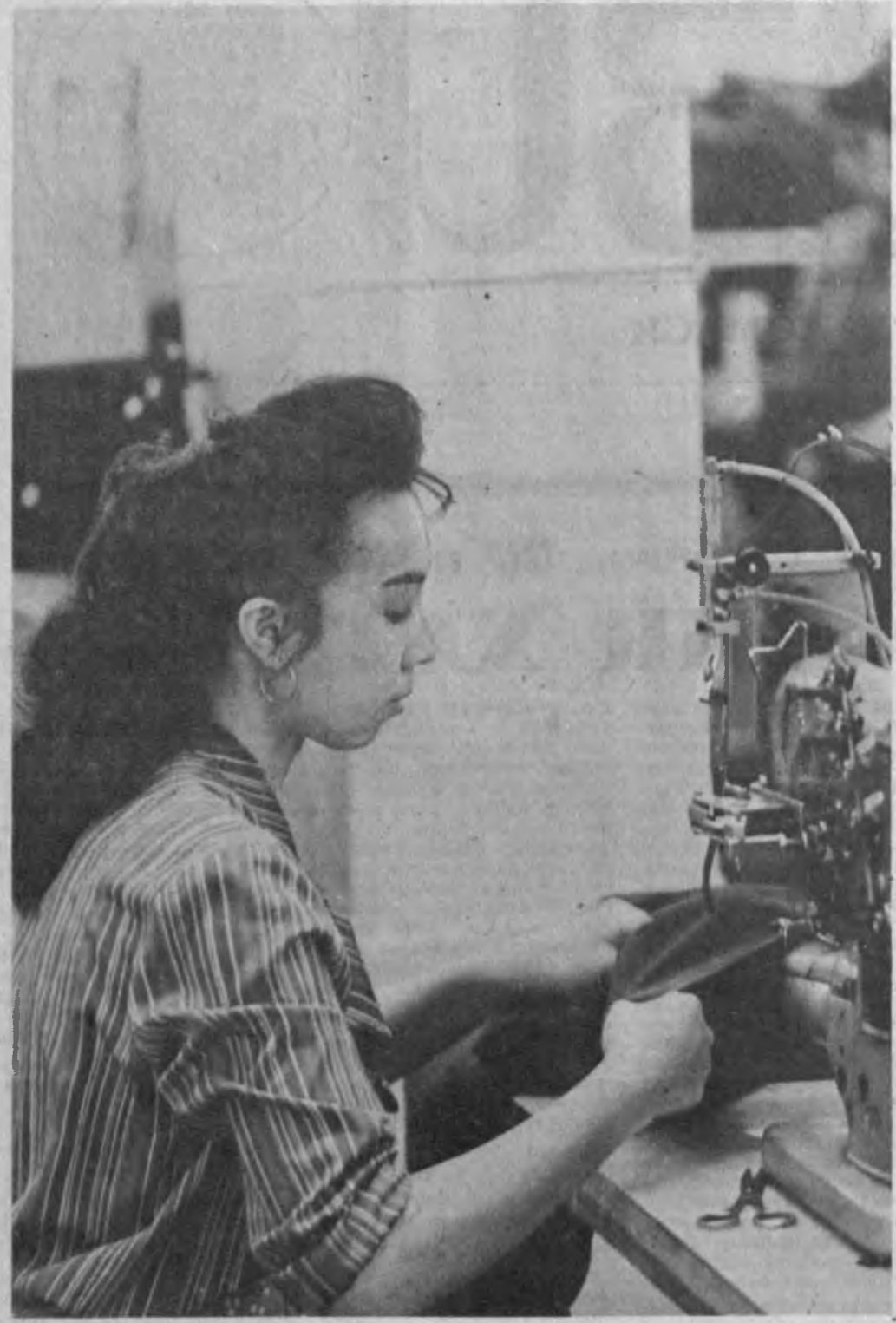
Тошкентдаги Ленин орденли «Юдуз» тикунчилик ишлаб чиқариш бirlашмаси жумҳурият энгил саноат корхоналари ўртсиде муайян мавзеге эга.

«Ота рози» ҳикмати оқсоқолларга қатнаб сарсон бўлган қарияларнинг аҳволига ачинамай бўлди.