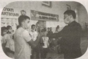
Муаллиф олган суратлар.