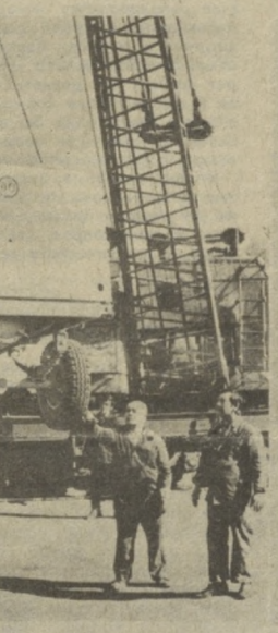
С хорошими показателями завершают инвентарную производственную программу рабочие ташкентского завода «Компрессор». Успешно выполнен месячный план. Не нарушали и график поставок.

Ежемесячно в адрес заказчика отправляется несколько сотен компрессоров. Особым спросом пользуются агрегаты марки ПР-10/Вм2 и ПР-6/8 м2. Примечательно и то, что вся основная продукция заводчан маркируется государственным Знаком качества.