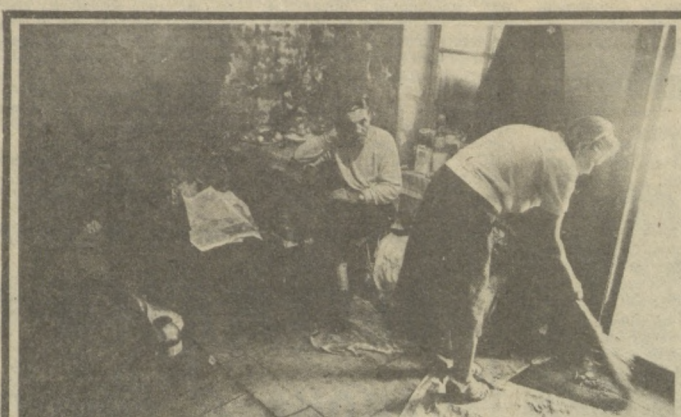
Помочь им можем только мы. Каждый в отдельности и все вместе, потому что все наше общество стало чуть-чуть человечнее, чуть теплее, чем раньше, — и это факт.