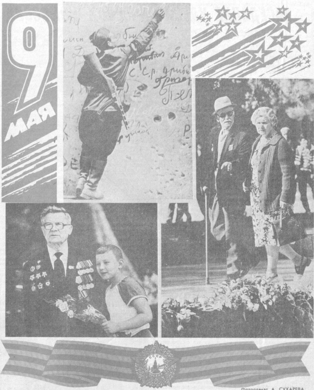
Фотоплакаты А. СУХАРЕВА.