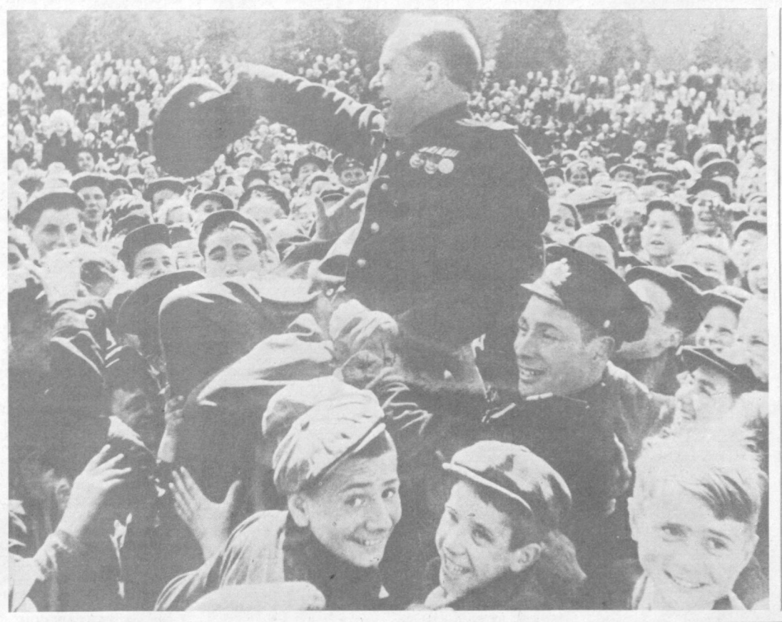
ПОБЕДА! Снимок М. Трахмана, сделанный 9 мая 1945 года на Красной площади в Москве. Фотохроника ТАСС.

Очередное заседание военно-патриотического клуба «Подвиг» посвящается 44-й годовщине Победы советского народа в Великой Отечественной войне. Председательствует член Военного совета — начальник Политического управления Краснознаменного Туркестанского военного округа генерал-лейтенант А. И. Овчинников.