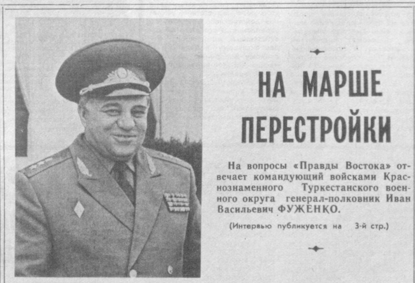
НА МАРШЕ ПЕРЕСТРОЙКИ