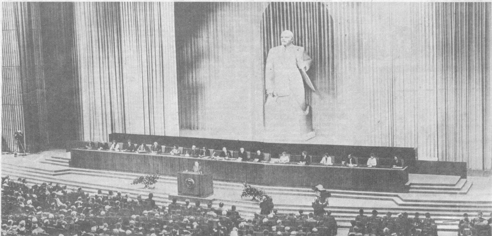
Москва, 25 мая в Кремлевском Дворце съездов начал работу Съезд народных депутатов СССР. НА СНИМКЕ: во время первого заседания Съезда.

В ходе избирательной кампании советский народ приобрел уникальный политический опыт. Миллионы избирателей только сей-