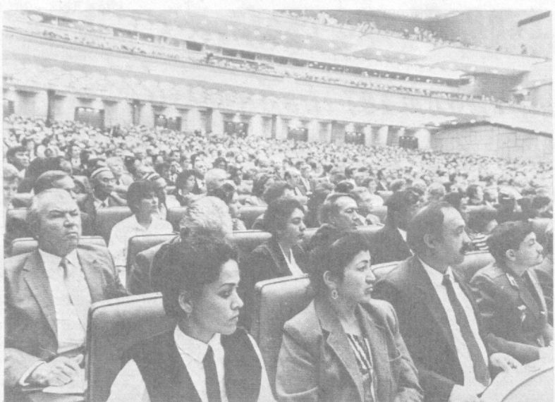
НА СНИМКЕ: депутаты из Узбекской ССР в зале во время первого заседания Съезда народных депутатов.