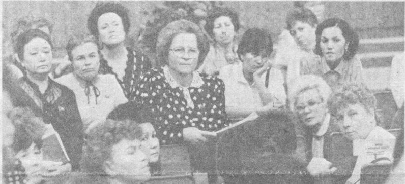
НА СНИМКАХ: народный депутат из Узбекистана Ф. Шарипов; идет собрание женщин — народных депутатов СССР.

перативами, в коллективно-экономических целях, являются одной из причин необоснованного увеличения заработной платы, вымывания дешевых товаров, ухудшения финансового положения.