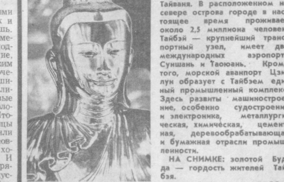
ТАЙБЭЙ — крупнейший город, административный и основной экономический центр Тайваня. В расположенном на севере острова городе в настоящее время проживает около 2,5 миллиона человек. Тайбэй — крупнейший транспортный узел, имеет два международных аэропорта Суншань и Таоюань. Кроме того, морской аэропорт Цанлу образует с Тайбэем единый промышленный комплекс. Здесь развиты машиностроение, особенно судостроение и электроника, металлургическая, химическая, цементная, деревообрабатывающая и бумажная отрасли промышленности.

Обстановка в Пекине остается напряженной. В городе слышна стрельба. Во многих местах разорваны тротуары, повалены деревья, видны обгоревшие остовы автомобилей, троллейбусов, автомашин.