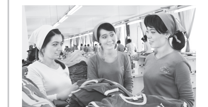
Фалларол туманидаги "Nargiza-teks" корхонаси ўз фаолиятини бошлаганига ҳали кўп вақт бўлгани йўқ.