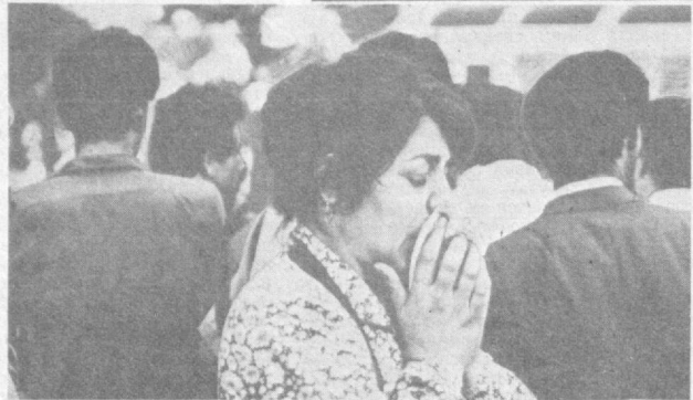
НА СНИМКАХ: работой штаба руководит Председатель Совмина УзССР Г. Х. Кадыров (фото сверху); в цепи охранения — солдаты внутренних войск (справа); безутешное горе; вот они — жуткие следы разбоя (слева внизу); задержаны милицией.

Да, он прав. Многие из местных жителей в эти дни помогают, пусть тайно, лишившимся крова. Все возможное делает созданный в Фергане республиканский штаб. В местах эвакуации турок-месхетинцев возводятся столовые, сюда отовсюду везут постельные принадлежности, предметы домашнего обихода. Работники Узбек-