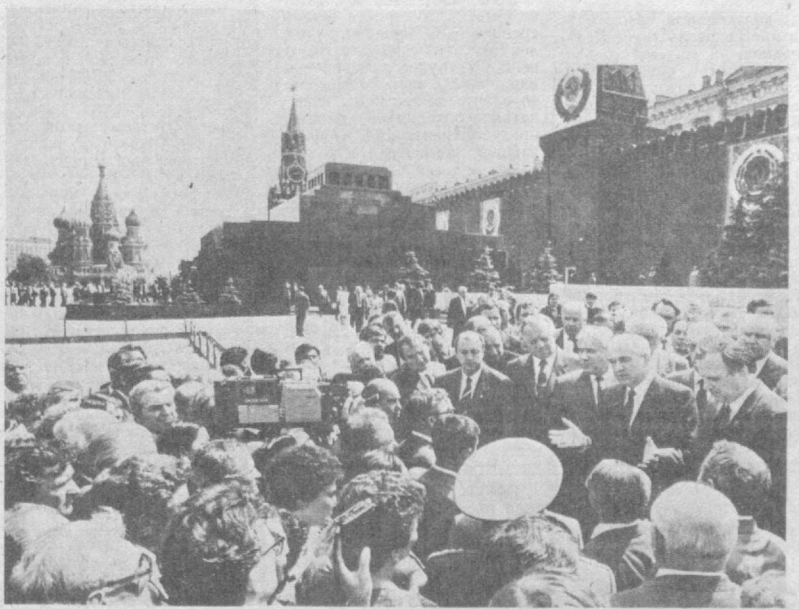
НА СНИМКЕ: после возложения венка к Мавзолею В. И. Ленина.