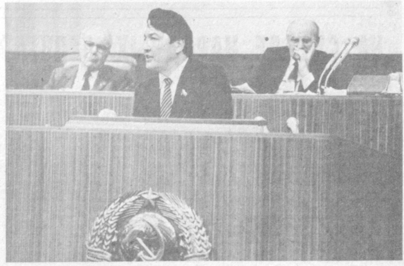
Выступает народный депутат СССР М. И. Умарходжаев, ректор Андийского государственного педагогического института языков.

На хлебные поля совхоза «Кашкар» вышли комбайны: началась уборка ячменя. Работают земледельцы первые комбайны по 32 центнера дает каждый гектар. И такой урожай дали почти полторы тысячи гектаров колхозников. Уборка организована в две смены. Однако в целом по области план производства зерна скорее всего выполнен не будет. Нормальное развитие хлебов зафиксировано лишь на 35 тысячах гектаров, расположенных в зоне орошения. Почти на ста тысячах гектаров на богаре посевы из-за капризов природы «остережились». Уборка зерновых началась почти на месяц позже обычного — из-за неблагоприятных условий этого года. Поэтому теперь главная задача — до минимума сократить сроки страды. В области создано 225 уборочно-транспортных отрядов. Буныеры всех комбайнов тщательно загерметизированы, агрегаты настроены. (Корр. УЗТА). Кашкарская область.