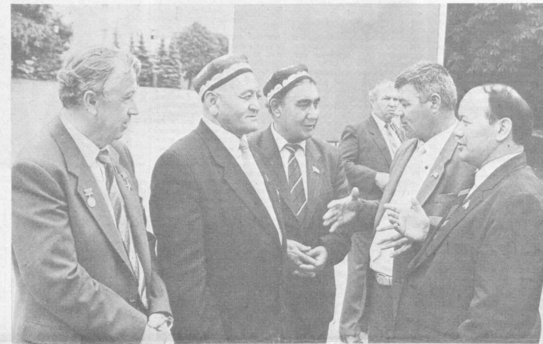
Много общих проблем у народных депутатов СССР из Таджикистана и Узбекистана.