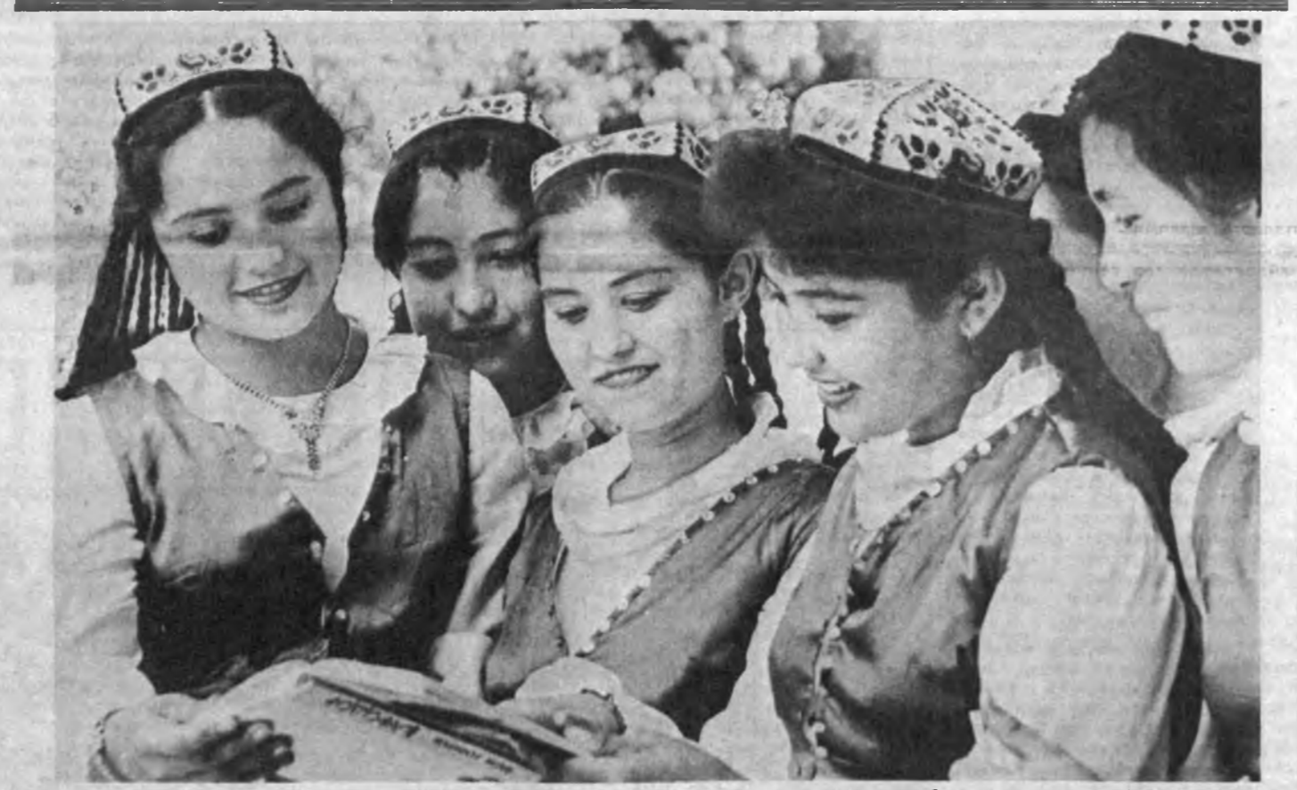
Танқили шоира Саида Зунирнова номидеги Ёш педагогика билим юртида ташкил этилган «Артирғул» банди ҳаваскорлини ансамбли ўз муъассарини янги кўй-қўшиқ ва рақслар билан тўшнуд қилиб келмоқда. СУРАТДА: ансамблининг бир гуруҳ иштирокчилари.