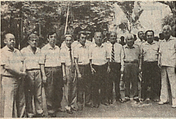
Суратда: Республика марказий газеталарининг бир гуруҳ вакиллари ва журналистлар.

27 июнь кун пойтахтдаги «Меҳржон» маданият ва истироҳат боғида республика матбуот ва оммавий ахборот воситалари ходимларининг касб байрами нишонланди.