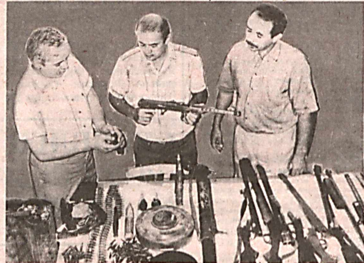
НА ТЕРРИТОРИИ самой южной области нашей республики — Сурхандарьинской регулярно проводятся оперативно-профилактические мероприятия, в ходе которых сотрудники органов внутренних дел предотвращают правонарушения, раскрывают сложнейшие преступления другими словами — ведут неустанную, полную риска борьбу против нарушений законности и правопорядка.

Одна из последних операций была направлена на обнаружение и изъятие у населения незаконно хранящегося огнестрельного, холодного оружия и боеприпасов.