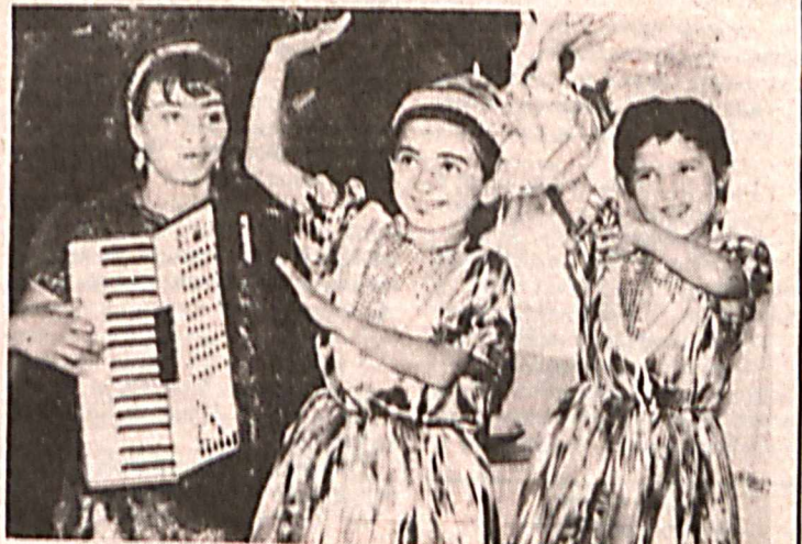
(Из газеты "Говорит и показывает Ташкент").