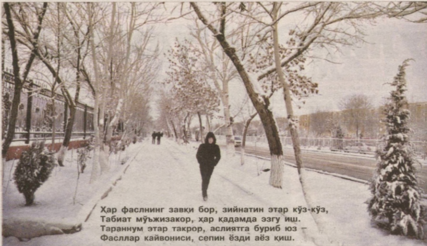
Хар фаслнинг завқи бор, зийнатин этар кўз-кўз, Табиат мўъжизакор, ҳар қадамда эзгу иш. Тараннум этар такрор, аслиятга буриб юз — Фасллар кайвониси, сепин ёзди аёз қиш.