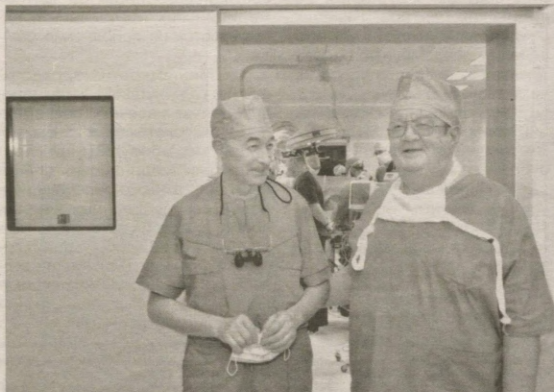
Норвегия, Швейцария ва Хиндустон каби тиббиёти ривожланган давлатлардагина бажарилади, холос. Бугун юртимиз ушбу мамлакатлар қаторидан бўлган давлатлардагина бажарилади.

Маълумот учун, жигарнинг терминал босқичдаги сурункали диффуз касалликлари, ўткир жигар етишмовчилиги, резекция қилинмайдиган манбали жигар касалликлари каби ҳолатларда фақатгина шу ёзро трансплантацияси бемор ҳаётини сақлаб қолиши мумкин. Бундай юқори технологик операциялар Америка, Россия, Германия,