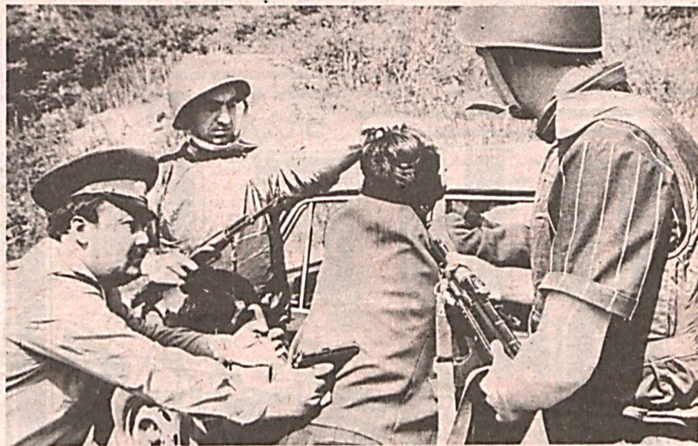
Необходимое значение придают в Чиланзарском РОВД боевой подготовке оперативников. Тренировки проходят в условиях, приближенных к реальным, подсказанным опытом ситуациям. На снимке: оперативная

К сравнительно молодой паре подошел молодой человек лет 25—28, долго не мог раскурить сигарету, внимательно при этом рассматривая золотые кольца и серьги женщины. Быстро расплатившись, я поспешил