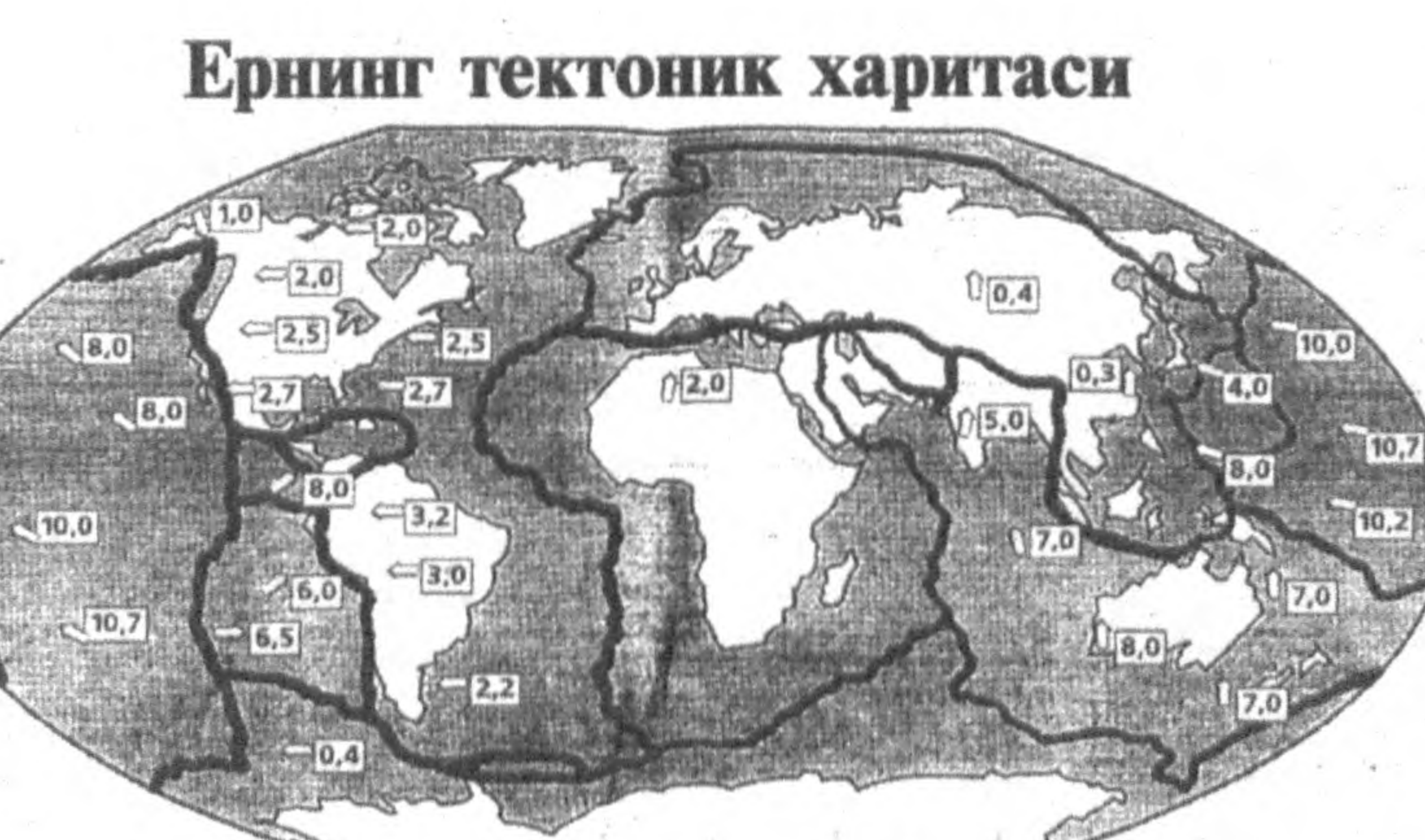
Бир йилда неча сантиметр ҳаракатланиши ва йўналиши кўрсатилган

«Радис» лойиҳаси бўйича олиб бориладиган ишлар якуни ҳақида Тошкент шаҳар ҳокимининг қароридан ҳам билса бўлади. Гап шундаки, Тошкент шаҳрининг юқори сейсмик ҳудудда жойлашганлиги, сейсмик мустақам қурилиш бўйича тадқиқотлар ва зилзиладан кейинги тиклаш ишларида мавжуд бўлиб таъжираниб инноватга олиб БМТнинг IDNDR Котибияти дунёнинг 9 шаҳарлари қаторида Тошкент шаҳрига ҳам «Радис» лойиҳасини бажариш учун 50000 АҚШ доллари миқдориде грант тариқасида маблағ ажратган. «Радис» лойиҳаси бўйича олиб бориладиган ишлар шундан далолат беримоқдаки, кучли зилзила вақтидаги хавф ва талафотларни камайтириш борасида ҳали қилиниши лозим бўлган бир қатор вазифалар ва муаммолар борлигини юзага чиқарди. Сўнги 5-6 йил мобайнида қурилган ўнлаб магистрал йўллар, транспорт