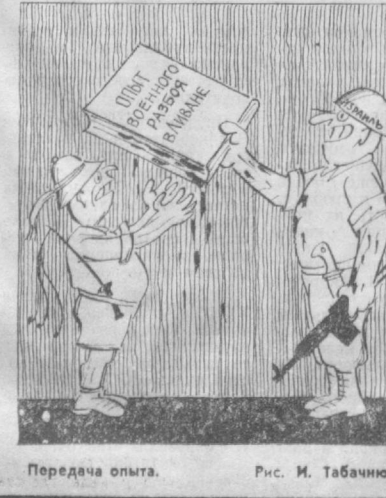
Передача опыта. Рис. И. Табачникова.

В связи с недавней выдчей Волиной Френции Клауса Барбарэ-Альтмана, купор дескина Пиночета газета «Аргентина» заявила: Чили — это не Боливия. Не может быть и речи о принятии мер, полезных тем на основании которых был выслан К. Барбарэ-Альтман.