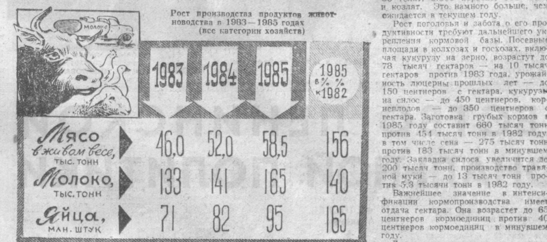
ДИАГРАММА дает представление о росте объемов производства животноводческой продукции.

Чтобы его обеспечить, необходимо планомерно увеличивать поголовье скота и птицы. Численность крупного рогатого скота в 1985 году составит 203 тысячи голов против 186,4 тысячи в 1982 году. Коров в стаде будет 88 тысяч — на 17 с лишним тысяч больше, чем сегодня.