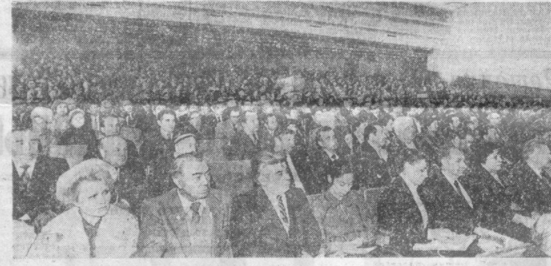
На снимке: в зале конференции.

Выдающиеся достижения КПСС и Советского государства явились созданием и развитием в ранние отсталых национальных окраинах крупных научных центров, способных решать актуальные проблемы научно-тех-