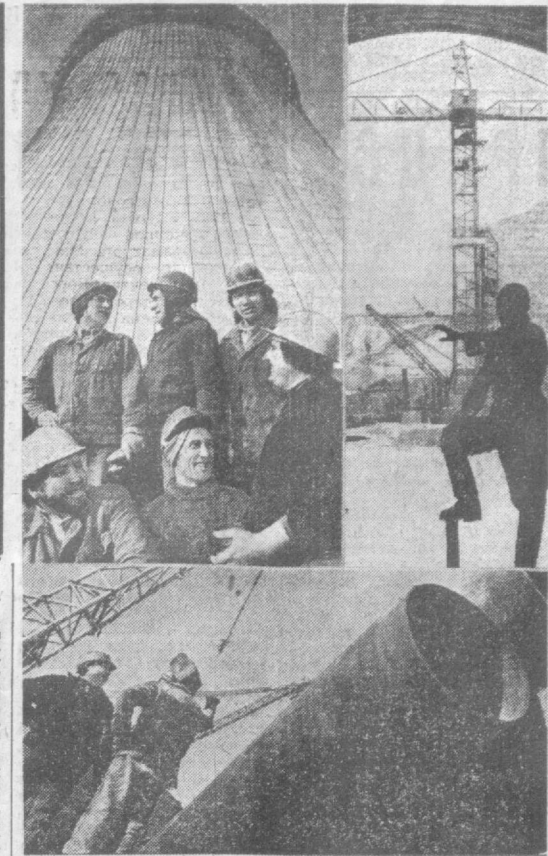
Ширится размах работ на строительной площадке Ангренинской ГЭС-2 — объекта, предусмотренного решениями XXVI съезда КПСС. Закончено возведение главного корпуса, в котором разместятся четыре энергоблока по 300 тысяч киловатт каждый. На двухсотметровую отметку досрочно выведены дымовая труба, которая будет самой высокой из всех подобных сооружений в Средней Азии — 330 метров. Стены «вертолантажи» бетонными-трубоками бригады Г. Шалера — из цельной арматуры раньше срока они подняли стены гребирин 120-метровой высоты. Оба уникальных объекта должны быть готовы к пуску первого энергоблока. А, кроме них, — монтаж топливонасосной и магистральной канал, многое другое. Вот почему в этом году резко возрастает объем работ — предстоит выполнить их на 18 миллионов рублей — в полтора раза больше, чем в прошлом году. На строительстве, на одном из участков — строительств, на участие привлечены...