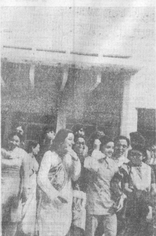
В начале нынешнего года в Дели открылся Дом советской науки и культуры. Частые гости здесь общественные и политические деятели, члены парламента, юристы, врачи, рабочие и крестьяне, студенты и школьники. На снимке: перед Домом советской науки, культуры и искусства в индийской столице.

УЛАН-БАТОР. Труженики молодого промышленного центра Монголия — города Дархан, развернули социалистическое соревнование за досрочное выполнение заданий текущей пятилетки, выпустили с начала года сверхплановую продукцию более чем на 1,5 млн. тургигов. Выросший на месте небольшой железнодорожной станции Дархан превратился во второй по величине индустриальный центр МНР. На его предприятиях выпускается ныне более 10 проц. валовой промышленной продукции республики.