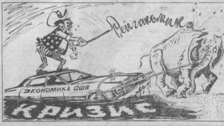
Засели... Рис. А. САФРОНОВА.

А. КУДИНОВ. Международный обозреватель «Правды Востока».