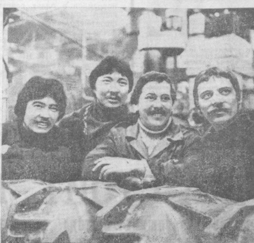
На снимке: группа передовиков производства цеха № 26 Ташкентского тракторного завода имени 50-летия СССР. Бригада коммунистического труда по сборке моторов выступила с инициативой: выполнить за девять месяцев годовое задание, рапортовать о завершении годового плана и дням празднования 2000-летнего юбилея Ташкента.

Участники конференции — ученые, специалисты с научными позициями рассматривают возможности для дальнейшего быстрого подъема различных отраслей сельскохозяйственного производства — основы реализации Продовольственной программы.