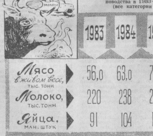
ДИАГРАММА наглядно показывает рост в области объемов производства животноводческой продукции до 1985 года. Чтобы его обеспечить, необходимо планомерно увеличивать поголовье скота и птицы. Численность крупного рогатого скота в 1985 году составит 362 тысячи голов против 341,1 тысячи в 1982 году. Коров в стаде будет 154 тысячи — на 22 с лишним тысяч больше, чем в минувшем году. Поголовье свиней к концу пятилетки достигнет 60 тысяч против 46,4 тысячи в 1982 году, овец и коз — миллиона против 943 тысяч.

Касаясь проблем реконструкции, участники говорили о необходимости действенных мер для безусловного ввода в нынешнем году первой очереди нового прокатного стана «300», третьей машины непрерывного литья и других объектов, а также инициатив рабочих и предприятий социальности.