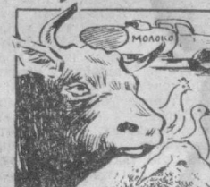
Рост производства продуктов животноводства в 1983—1985 годах (все категории хозяйств)