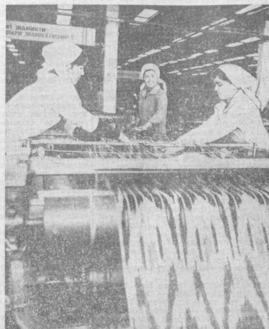
Крупный цех — один из передовых на Наманганском комбинате авиатканей имени XXV съезда КПСС. За высокие трудовые показатели, работу без отставок, четкую организацию труда и дисциплину, всемерную экономию ресурсов его коллектив награжден переходящим Красным знаменем ткацкого производства комбината.

Участники переговоров констатировали, что военная угроза, исходящая от агрессивных кругов империализма, нависла и над африканским континентом. Именно поэтому миролюбивые африканские государства вместе со всеми прогрессивными силами мира активно включились в антиимпериалистическую борьбу. Они также обратили внимание на опасность попытки империалистов внести рас-