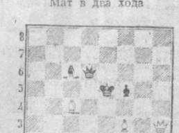
Мат в два хода