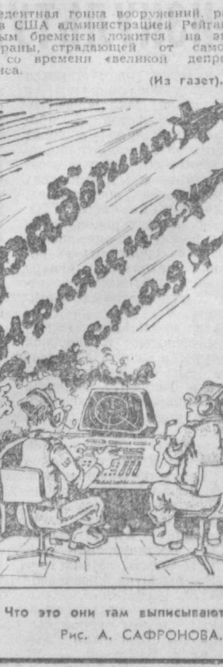
Эй, парни! Что это они там выписывают! РИС. А. САФРОНОВА.

Власти Ливана, являющиеся участниками заседания, должны были прекратить свои действия на территории Ливана. (ТАСС).