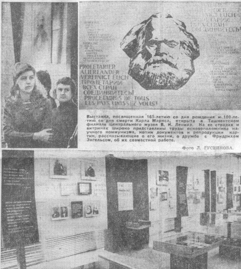
Выставка, посвященная 100-летию со дня рождения и 100-летию со дня смерти Карла Маркса, открыта в Ташкентском филиале Центрального музея В. И. Ленина. На ее стендах и витринах широко представлены труды основоположника научного коммунизма, копии документов и репродукции картин, рассказывающие о его жизни, о дружбе с Фридрихом Энгельсом, об их совместной работе.