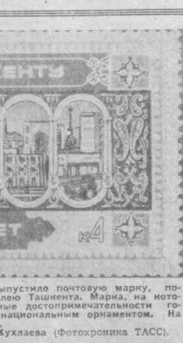
Министерство связи СССР выпустило почтовую марку, посвященную 2000-летию Юбилею Ташкента...