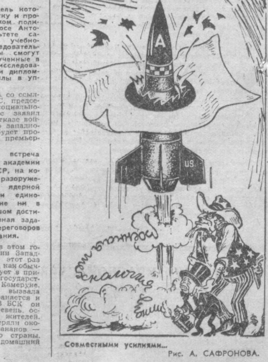
Рис. А. САФРОНОВА.