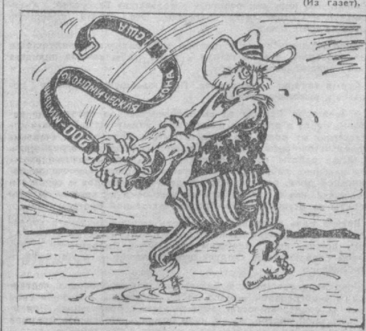
Распускается... Рис. А. САФРОНОВА.

К. ЦИКАНОВ. Соб. корр. «Правды Востока». Хорезмская область.