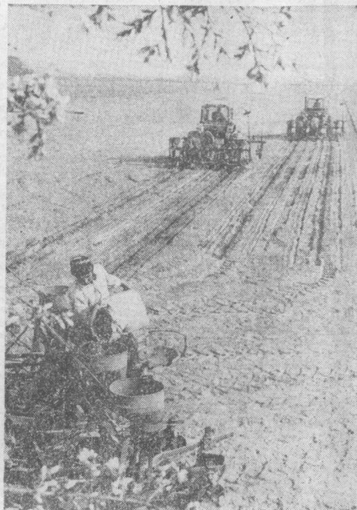
Механизаторы совхоза имени М. Горького Балхашинского района первыми в Анджанской области начали выборочный сев хлопчатника. Коллектив хозяйства дал сею вырастить на каждом из 3,100 гектаров 40-центнерный урожай «белого золота» и сдать нынче на государственный хранилище на две тысячи тонн хлопка больше, чем прошлой осенью. На снимке: сев хлопчатника на полях второго отделения хозяйства.

Горячая трудовая пора наступила на весеннем поле республики. И долг сельских партийных организаций, руководителей и специалистов сельскохозяйственных органов, советов агропромышленных объединений — так организовать работу на местах, скоординировать деятельность ответственных за урожай подразделений, чтобы посевная повсеместно прошла четко, быстро и организованно, в оптимальные сроки была обеспечена качественная работа. Это важнейшее условие в достижении главной цели — получения высоких урожаев на каждом поле, успешной реализации планов и обязательств 1983 года и всей пятилетки в свете решения майского и ноябрьского (1982 г.) пленумов ЦК КПСС.