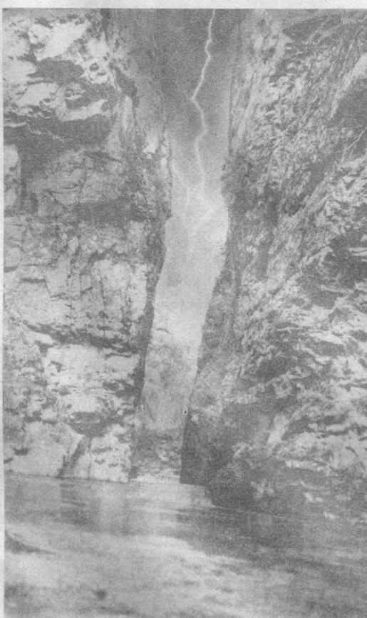
Редное явление. Фотоальбом запечатлел молнию в Конусном ущелье Чаткальских гор.

В зоопарке всегда увидишь что-нибудь удивительное. Старожилы Термеза рассказывают, что в этом царстве зверей лет пятнадцать назад повторилась история, рассказанная когда-то Л. Н. Толстым. Помните его книжечку для детей «Лев и собачка»? Так вот, точно так же, как в этой книжечке, жили в добром согласии левья и собачка. И точно так же, как в рассказе Толстого, вскоре после того, как не стало собачки, погибла и ее подруга — Пусья. Грустная история Нынешняя куда веселее. Тигрица по имени Галя и дворяшка Жучок вот уже несколько месяцев живут вместе и находят общий язык. Больше того, Жучок находится в явно привилегированном положении. Если Галя хочет поиграть со своим другом, а он к этому не расположен, песик огрызается, и этого достаточно, чтобы тигрица оставила его в покое. Волеу клетки, где живут они, всегда много посетители. Л. РУЯТКИНА, Корр. газеты «Ленинское знамя», г. Термез.