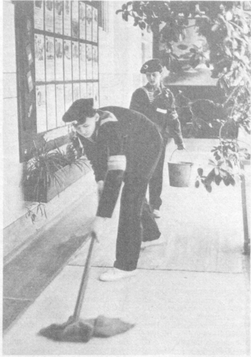
школе есть для этого все, а главное — высокопрофессиональные, опытные наставники. Они так готовят молодежь, что впоследствии от командования Военно-Морских Сил СССР, где служат воспитанники школы, в ее адрес приходят десятки благодарственных писем. В прошлом году Ташкентская морская школа ДОСААФ Узбекской ССР была награждена переходящим Красным знаменем главнокомандующего Военно-Морским Флотом СССР.

А потом для курсантов начинаются трудовые будни. И не беда, что Ташкент отстоит от моря на тысячи километров. Это не мешает ребятам познавать азбуку морского дела. В