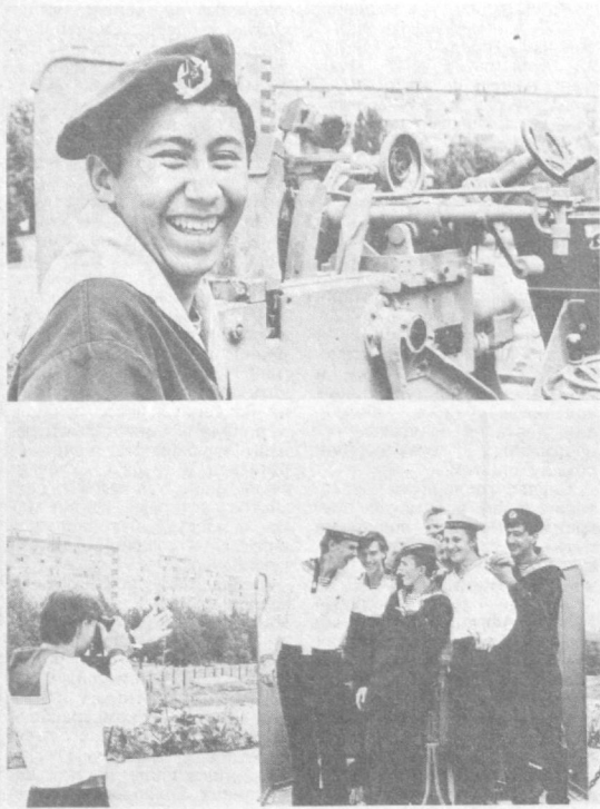
ТАШКЕНТ. Посвящение в курсанты Ташкентской морской школы ДОСААФ Узбекской ССР стало традицией. Его удостоиваются юности, достигшие призывного возраста и желающие служить в Военно-Морском Флоте Вооруженных Сил СССР.

Этот день проходит торжественно, многолюдно и памятно. В церемонии принимают участие ветераны войны и труда, бывшие курсанты, уже прошедшие службу в армии, родители, друзья. Заучат наставления, советы, добрые пожелания.