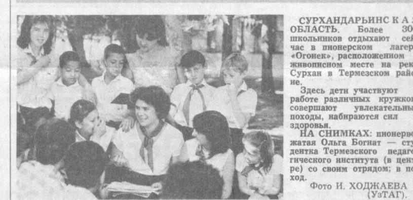
Сурхандарбинские школьники отдыхают в пионерском лагере «Огонек», расположенном в живописном месте на реке Сурхан в Термезском районе.

Здесь дети участвуют в работе различных кружков, совершают увлекательные походы, набираются сил и здоровья.