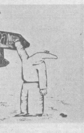
Рис. Л. МЕЛЬНИКА.