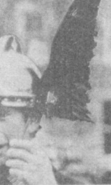
Принц Чарльз — наследник престола в Великобритании — в таком экзотическом шлеме на Шетлендских островах может вполне ощущать себя викингом...