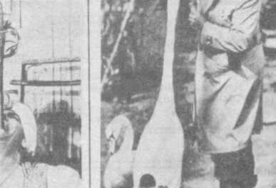
ФРГ. В неожиданном ракурсе сделал снимок корреспондент АП в зоопарке Гамбурга: так выглядит лебединья шея, когда ее обладатель потянулся за лакомством.