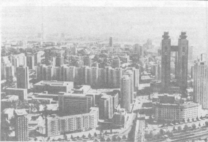
К XIII ВСЕМИРНОМУ ФЕСТИВАЛЮ МОЛОДЕЖИ И СТУДЕНТОВ