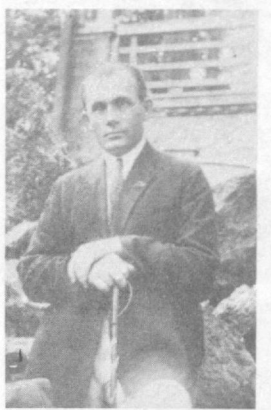
подходим к 1929 году, году «великого перелома», как его называли с высоких трибун. Он помнит те годы, по собственному опыту знает, во что обошлась этот «великий перелом», чего стоила сплошная коллективизация, сколько она принесла жертв и драм.

Известно, что набравший в те годы силу культ личности Сталина не допускал малейшего инакомыслия. Ревниво следил «отец» за популярностью отдельных личностей. В стране был один «вождь и учитель всех времен и народов, великий, мудрый, знающий все и вся». Малейшая, даже невольная тень на этом «солн-