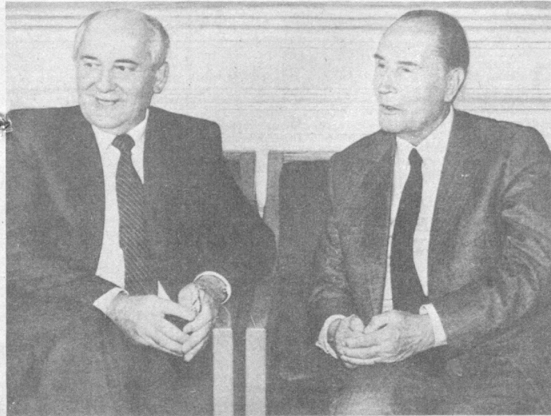
Во время беседы.