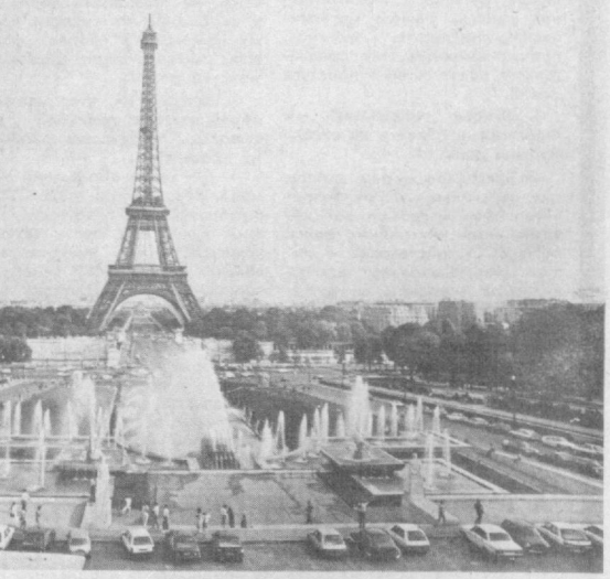
Символ Парижа.