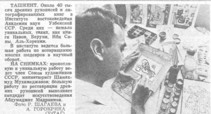
Ташкент. Около 40 тысяч древних рукописей и литографированных книг в Институте востоковедения Академии наук Узбекистана...