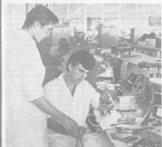
ТАШКЕНТ. Учебно-научный производственный центр создали совместно ташкентский завод электронно-вычислительных машин «Алгоритм» и политехнический институт. Оно десятилетиями на кафедре вуза открывало филиалы на предприятиях. А кафедра конструирования электронно-вычислительной аппаратуры полностью перешла в один из новых заводских корпусов. На предприятии привлекают студентов и их преподавателей и организация производства персональных компьютеров «Алгоритм». Многие из студентов в цене уже уверенно проучат работу, требующую самой высокой квалификации.

Начальник Ташкентского госсеминации, заслуженный работник сельского хозяйства Каракалпакской АССР.