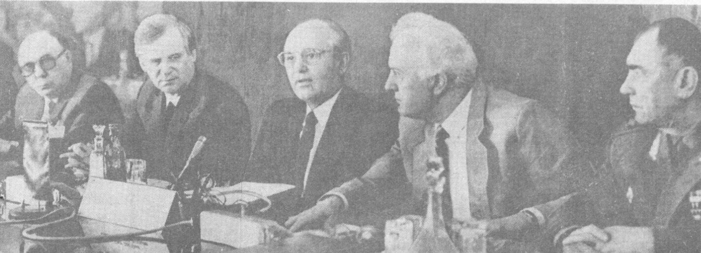
НА СНИМКЕ: советская делегация в зале заседания.