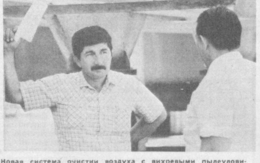
Новая система очистки воздуха с вихревыми пылеуловителями установлена на Чиназском хлопкозаводе. Она позволяет в 3-4 раза снизить загрязненность выходящего воздуха. Разработана она и внедрена в промышленное производство учеными НПО «Узхлоппром» и Московского текстильного института.