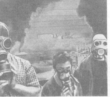
нефти в Южно-Ферганский канал из-за прорыва нефтепровода Андиканского нефтегазодобывающего управления. В Сырдарье у переправы Чильмохрам содержание нефтепродуктов достигло 23 июня 252 ПДК.

Остается высоким содержание гексахлорана и диндана в реках Сырдарья, Зеравшан, Амударья — 4-24 ПДК. Снизилась концентрация гексахлорана до 1-8 ПДК в Кайракунском, Туямуномском, Султаниндерском водохранилищах.