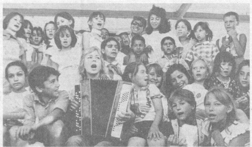
ГОСТИ РЕБАТ ИЗ ГОРОДА-ПОБРАТИМА

Желающий приобрести квартиру гражданин должен обратиться с заявлением в исполком местного Совета народных депутатов, в организацию, на предприятие, которым принадлежит жилье площадь. Его заявление должно быть рассмотрено в месячный срок.