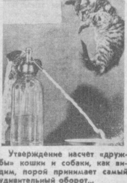
Утверждение насчет «дружбы» кошек и собак, как видишь, порой принимает самый удивительный оборот...

НАШ АДРЕС: 700083, Ташкент, ул. Ленинградская, 32.