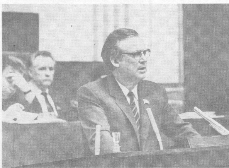
Н. И. Рыжков, председатель Верховного Совета СССР.

В. КАРИМОВ. Сиб. корр. «Правды Востока». Самаркандская область.