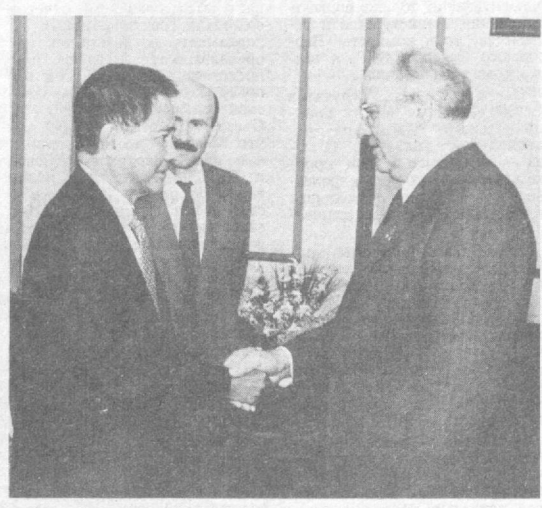
Перед началом беседы.

19 июля М. С. Горбачев принял секретаря по иностранным делам Республики Филиппины Р. Манглауса. Он передал М. С. Горбачеву личное послание президента К. Акино. Приветствуя гостя, М. С. Горбачев охарактеризовал его первый официальный визит в СССР как важное событие в советско-филиппинских отношениях. Мы ценим связи с этой страной, вознившие и получившие развитие в последние годы. Улучшение советско-филиппинских отношений отвечает интересам двух стран, мира и безопасности в Азии и на Тихом океане. Советский Союз, продолжал М. С. Горбачев, придает большое значение процессам, идущим в азиатско-тихоокеанском регионе. Эти процессы приобретают динамику, позитивную направленность. Мы готовы сотрудничать со всеми без исключения странами этого огромного и сложного региона. На основе такого общего подхода СССР предпринимает практические шаги, направленные на ослабление военного противостояния, в АТР, готов обсуждать со всеми заинтересованными странами любые вопросы, относящиеся к укреплению безопасности государств, к мерам доверия, урегулированию региональных конфликтов. Р. Манглаус, отметив новый характер советско-