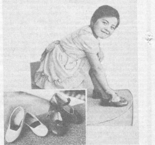
Янгиюльское производственное обувное объединение. Узбекское рекламное производственное объединение ВПО «Союзреклама» (телефон 45-37-24).

Приобрести детскую обувь Янгиюльского производственного обувного объединения можно в специализированных магазинах и отделах магазинов по продаже обуви, а также в магазинах фирменного торгового объединения «Узбекистан».