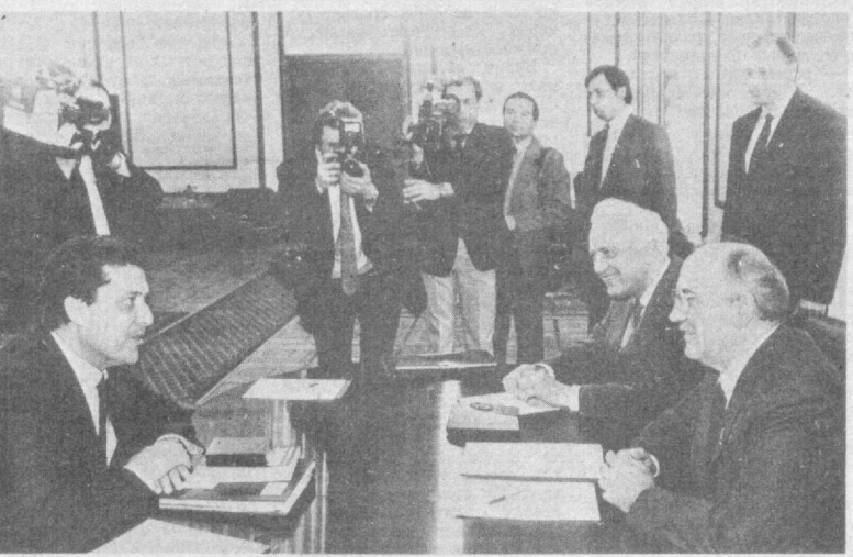
Во время беседы.