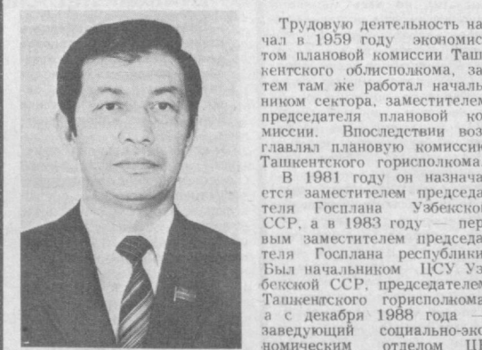
Родился в 1939 году в семье служащего. Узбек, член КПСС с 1962 года, образование высшее, окончил Ташкентский финансово-экономический институт, экономист, доктор экономических наук.