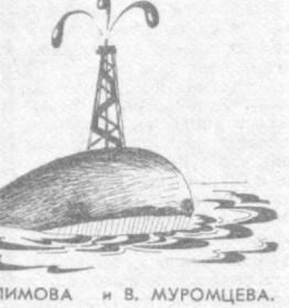
Рис. Ю. ГАЛИМОВА и В. МУРОМЦЕВА.