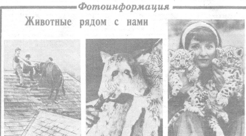
До сих пор фермер и его помощники из швейцарской деревушки в долине Энтельбах не знают, как 330-килограммовый бычок смог очутиться на крыше коровника.