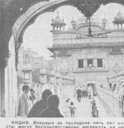
ИНДИЯ. Впервые за последние пять лет иностранные туристы могут беспрепятственно заглянуть на один из шедевров индийского средневекового зодчества — Золотой храм в Пенджабском городе Амритсаре. Как здесь официально объявлено, снято действие запрета на въезд иностранцев в штат Пенджаб.