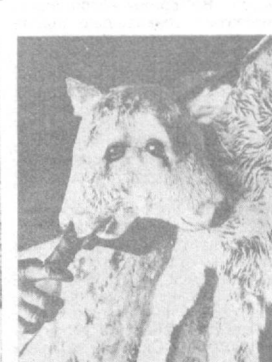
Такой необычный теленок с двумя головами родился в провинции Замора, расположенной в центре Испании. Как сообщало агентство ЭФЭ, теленок развивается нормально и весит уже 50 килограммов, подкармливают его, как и всех остальных, из соски.