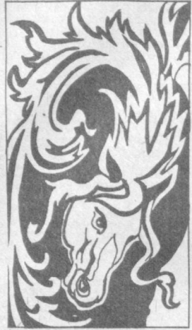
Рис. Т. Подгурской.

...Поэзия последних джизакских светов, и мы выжили на широкой авто-страде. По обе стороны дороги зеленели сады, виноградники, огороды. Но вот она ныряет под виадук, и пейзаж резко меняется. Перед нами выжженная солнцем равнина. Это Джизакская степь, местами еще представляющая в первозданном облике.