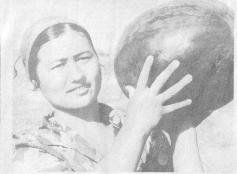
Год назад на целинных землях Комсомольского района появился восьмой по счету совхоз «Андижан». И вот — первый урожай бахчевых, а вместе с ним и первый успех тружеников совхоза. Звено бахчеводов

УМЕЛОЕ ПРИМЕНЕНИЕ ЭВМ ДАЕТ БОЛЬШИЕ ВЫГОДЫ НАРОДНОМУ ХОЗЯЙСТВУ РЕСПУБЛИКИ смазочных материалов, простои механизмов, создать высокорентабельные хлопководческие и овишеводческие хозяйства. Один из решающих факторов подъема сельскохозяйственного производства в республике — полное и эффективное использование водных ресурсов. Специалисты нашего бюро участвуют в создании математических моделей управления водными ресурсами региона и теоретических основ такого управления. Создается модель АСУ переброски части стока сибирских рек в Среднюю Азию, автоматизируются процессы управления в крупных водохозяйственных комплексах, таких как Южно-Голландский канал, бассейн реки Сырдарья, Андижанское водохранилище. Важное значение придается автоматизации проекти-