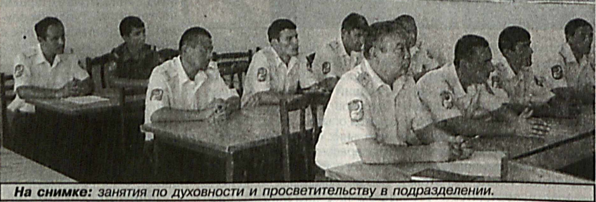
На снимке: занятия по духовности и просветительству в подразделении.

Личный состав принимает активное участие во всех профилактических мероприятиях, проводимых органами внутренних дел в Андижанской области. Наши ребята четко и профессионально действовали во время проведения в Анджане «Универсиады - 2010». Встретили участников универсиады и гостей в аэропорту, охраняли общественный порядок в местах проведения спортивных состязаний. Коллектив роты дружный и сплоченный. Каждый сотрудник имеет несколько смежных профессий, что позволяет применять принцип взаимозаменяемости в зависимости от складывающейся обстановки. За прошедшие с момента создания подразделения годы коллектив обновился, ушли на заслуженный отдых 14 сотрудников. Они частые гости в роте. Передают свой богатый опыт молодому пополнению. Дни рождения, свадьбы и другие торжества здесь стараются отмечать всем коллективом. Впереди много сложных задач. Но нет сомнения в том, что личный состав подразделения предпримет все усилия для того, чтобы выполнить их качественно и в установленный срок. Б. КЛЕЙМАН, соб. корр. Андижанская область.