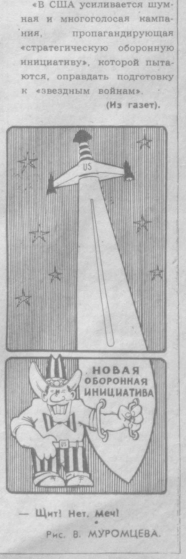
— Шит! Нет, Мел! Рис. В. МУРОМЦЕВА.