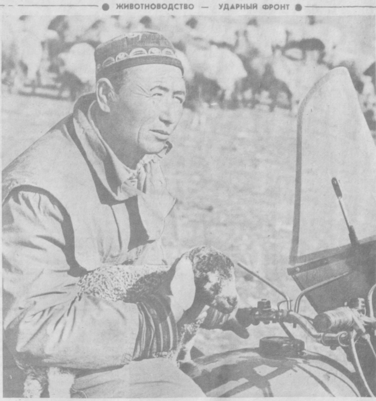
44 тысячи овец выпасается в отарах маркучевской совхоза «Фариш» Фаришского района Джизакской области. Труженики хозяйства обильно в этом году сдать государству 15.500 каракулевых смушек.

Почти треть энергии, вырабатываемой сегодня в мире, расходуется на преодоление сил трения. В результате техника выходит из строя гораздо раньше, чем используются ее потенциальные возможности. Только на капитальный ремонт и амортизационные отчисления тратится ежегодно сотни миллиардов рублей. Пути решения этой актуальной проблемы — в центре внимания участников международной конференции «Трение, износ и смазочные материалы», которая начала работу 22 мая в Ташкенте. Открыл конференцию и выступил с докладом директор Института проблем механики Академии наук СССР академик А. Ю. Ишлинский. В работе форума принимают участие видные ученые стран — членов СЭВ, развитых капиталистических государств. Обсуждаются проблемы износостойкости, изучения физико-химических и механических процессов при трении, разработки эффективных смазок, создания материалов на основе ионной и лазерной обработки. Ученые делятся опытом, наметят темы совместных исследований. (УзТАГ).