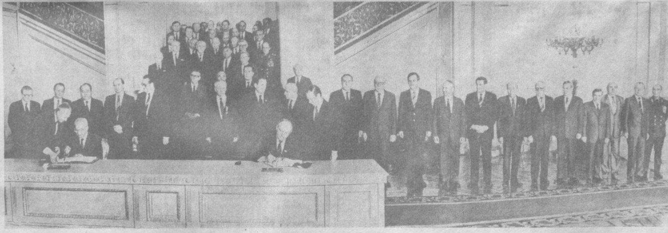
Во время подписания.