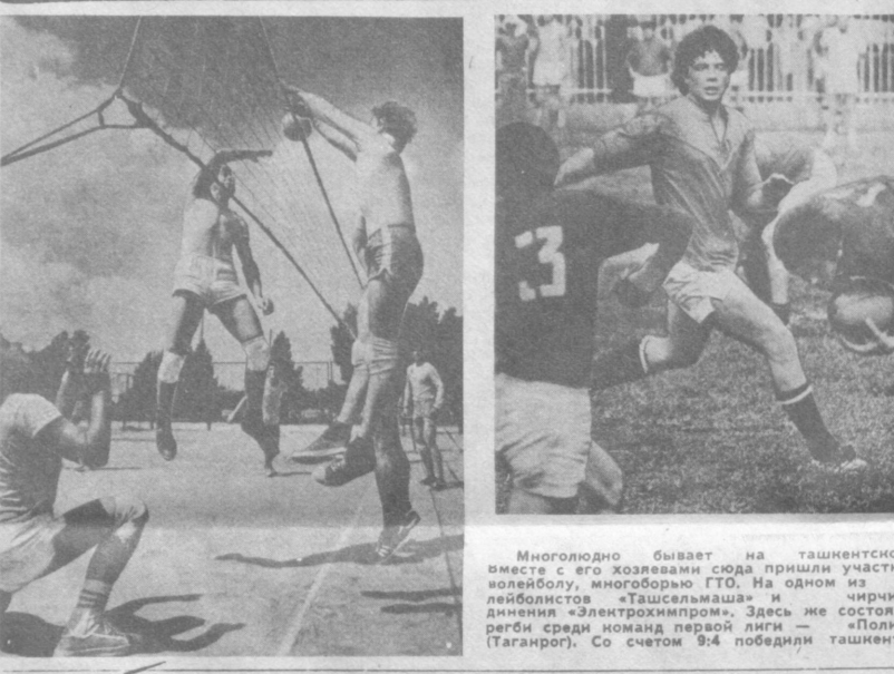
Многолюдно бывает на ташкентском стадионе «Текстильщик». Вместе с его хозяевами сюда пришли участники областных соревнований по волейболу, многоборью ГТО.

Общество охраны природы и создано для того, чтобы координировать усилия всех в борьбе с нарушениями закона об охране природы.