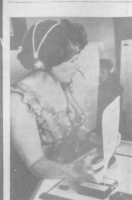
Сегодня в Ташкентском педагогическом училище имени В. И. Ленина начинается работу Всесоюзное совещание преподавателей русского языка педучилищ Средней Азии, Казахстана и Закавказья. Созданное в 1922 году, это училище — одно из старейших в стране среди родственных учебных заведений. Здесь накопились богатые традиции, опыт в подготовке педагогов для начальных классов и, в частности, учителей русского языка для школ, где преподавание ведется на узбекском.